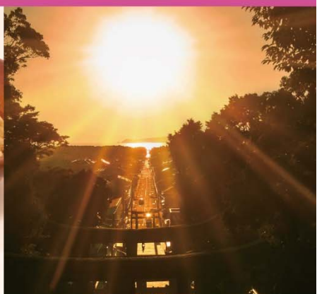
宮地嶽神社からの光の道（福津市）