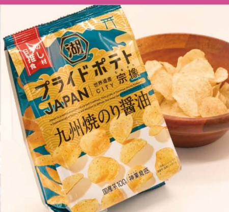
宗像市×湖池屋「プライドポテトJAPAN 宗像九州焼のり醤油」