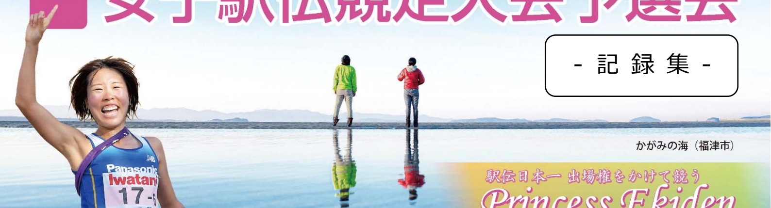
かがみの海（福津市）