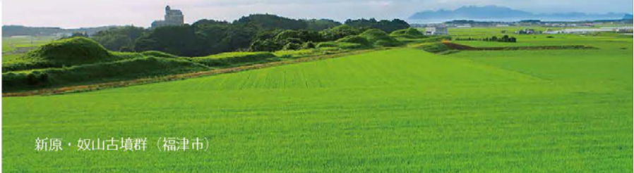
新原・奴山古墳群（福津市）