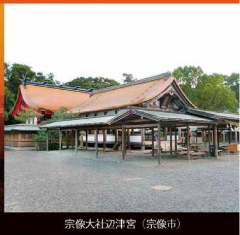
宗像大社辺津宮（宗像市）