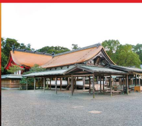
宗像大社辺津宮 (宗像市)